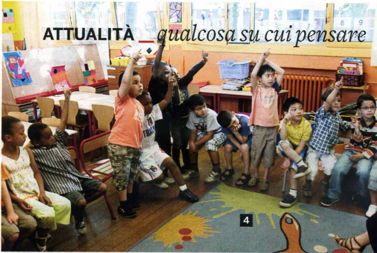
A sinistra, un asilo a Parigi. In Francia sono in gran parte statali: li utilizza l'80 per cento delle donne con un figlio. Sotto, un insegnante a domicilio aiuta un bambino francese a fare i compiti. Lo Stato consente sgravi fiscali ai genitori per l'istruzione dei figli.